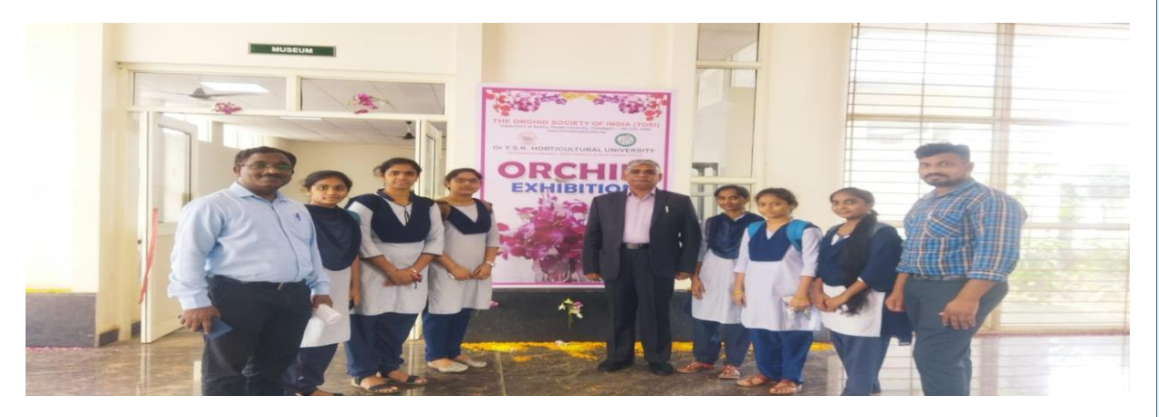
The students of Horticulture & Botany visited The YSR Horticulture University 11 | Page