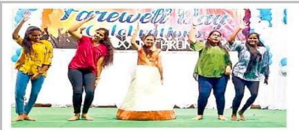
నృత్యం చేస్తున్న నర్సింగ్ విద్యాల్థినులు