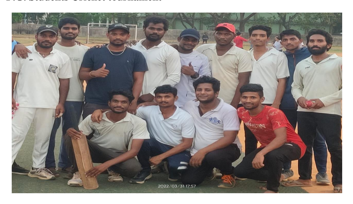
The students of P.G. P.R.G.C (A) had Cricket tournament on 28th & 29th of March2022