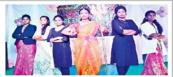
పీఆర్ కళాశాలలో వివిధ వేషధారణలో..

వెంకట్నగర్, న్యూస్ టుడే: ఓ వైపు అదర గొట్టే నృత్యాలు.. ఉర్రూ తలూగించే పాటలు.. ఆలోచింపజేసే నాటక